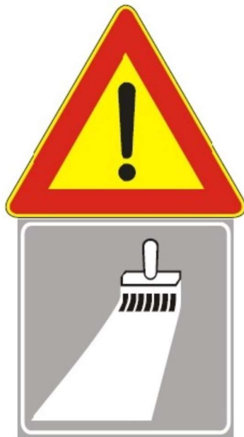
Figura Il 391 Art. 31