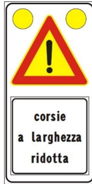
Figura Il 391c Art. 31